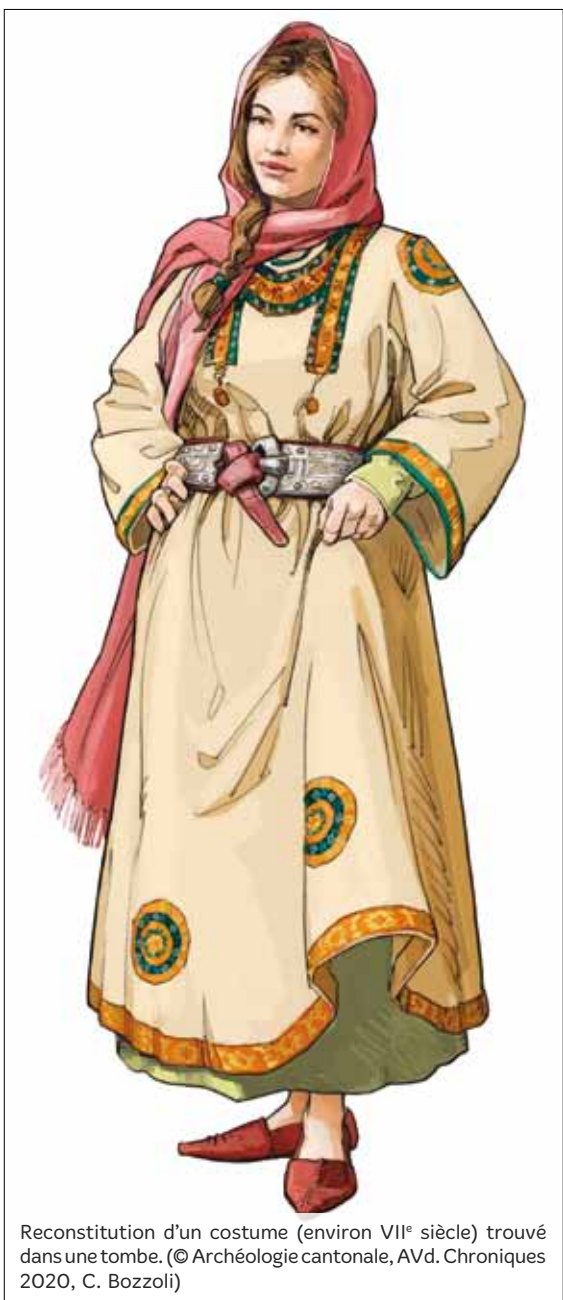
Reconstitution d'un costume (environ VII e siècle) trouvé dans une tombe.

Fouillant, piochant, creusant, grattant parfois au pinceau, les archéologues ont ramené à la surface une grande quantité de vestiges. Si la majorité de ces derniers remonte au Moyen Âge, des traces bien plus anciennes ont été mises à jour. Les plus lointaines datent ainsi de plus de 5'000 ans !