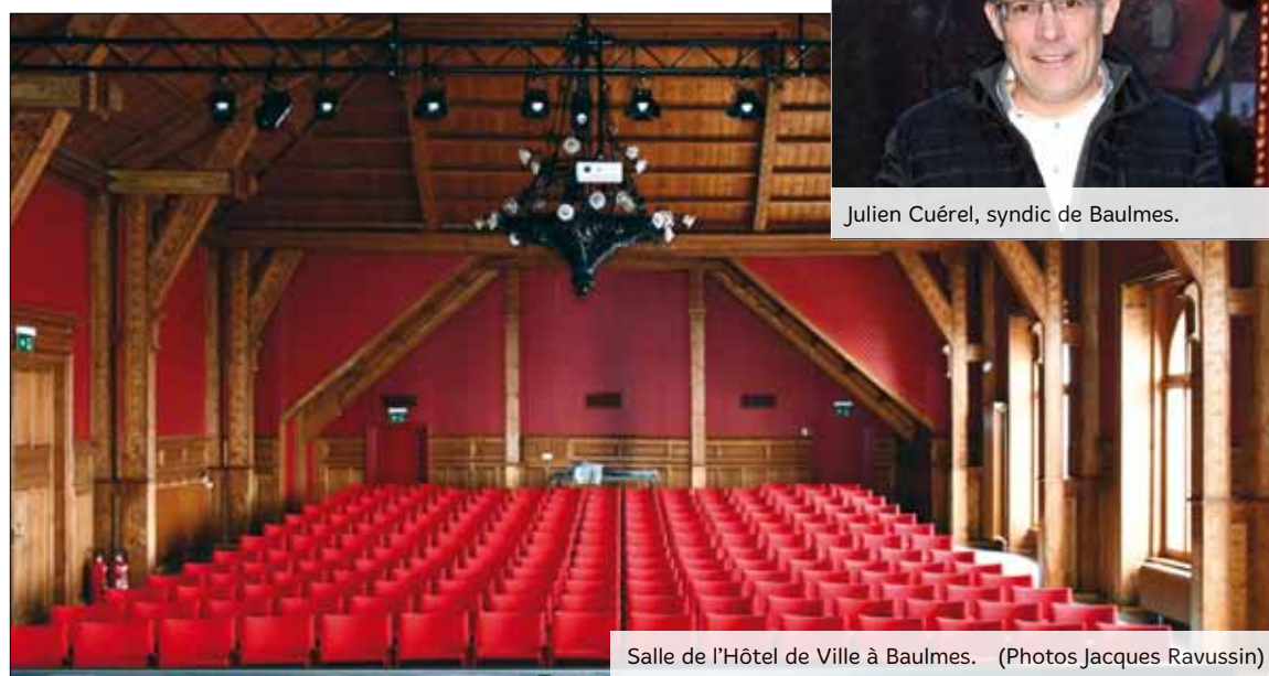
Salle de l'Hôtel de Ville à Baulmes.