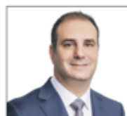
Michoël Buffat, Conseiller national UDC VD