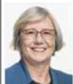
Laurence Fetschmann Conseillère nationale PS GE