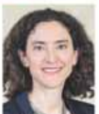
Isabelle Pflüggen-Eichenberger Conseillère nationale Les Verts GE