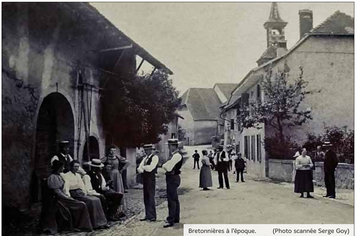
Bretonnières à l'époque.

Peut-être certain(e)s seront-ils intéressés à entreprendre la même démarche pour leur village. Il est assez facile de s'y mettre, ne pas hésiter à établir un contact. Le site ne rassemble d'ailleurs que des passionné(e)s de la plongée dans le passé.