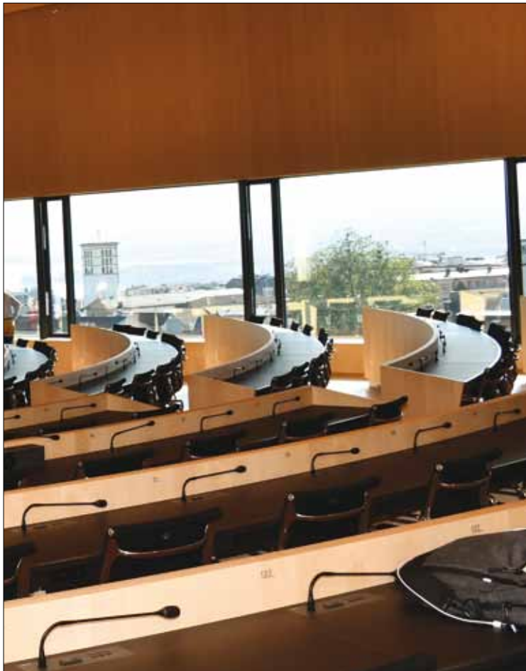
Salle du Parlement cantonal.