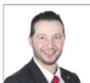
Yvan Pahud, Député UDC VD