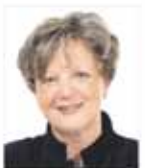
Isabelle Chassot Conseillère aux États Le Centre FR