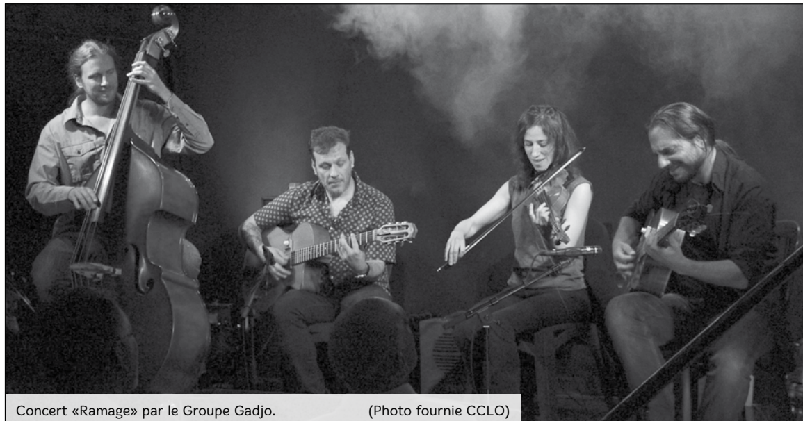
Concert «Ramage» par le Groupe Gadjo.

Réservations: www.commissionculturelle-orbe.ch ou par SMS au 079 741 87 70.