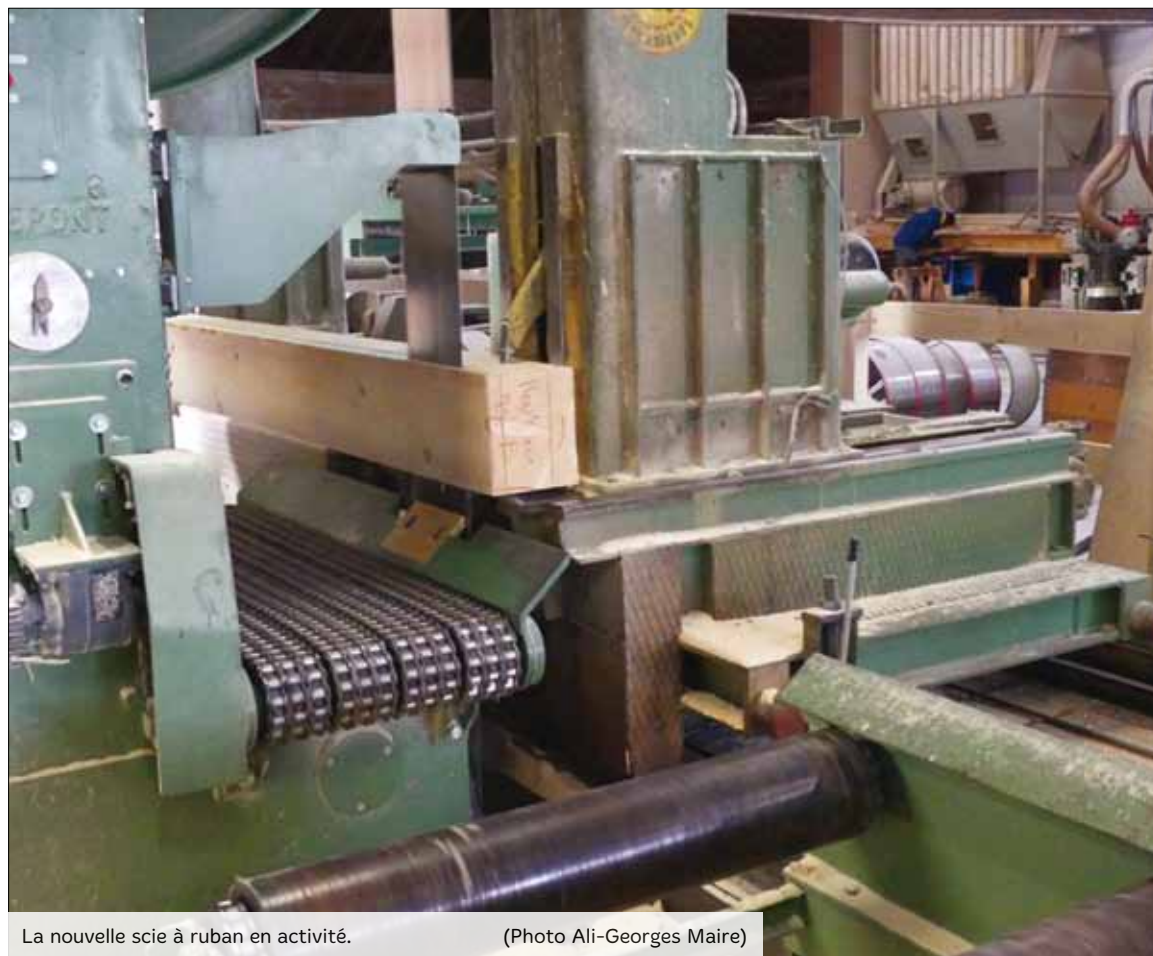
La nouvelle scie à ruban en activité.

Dans la préparation des grumes au sciage, l'étape des couenneaux (restes de bois scié d'un côté et en écorce de l'autre) a été remplacée par une tête raboteuse qui produit des plaquettes. Selon les projets à l'étude, ces produits utilisés en chauffage trouveront une utilisation locale. Il en va de même pour la récupération de la sciure. Si les bois sont actuellement écorchés en forêt il est prévu un écorçage en scierie avec là aussi une utilisation locale de ce sous-produit.