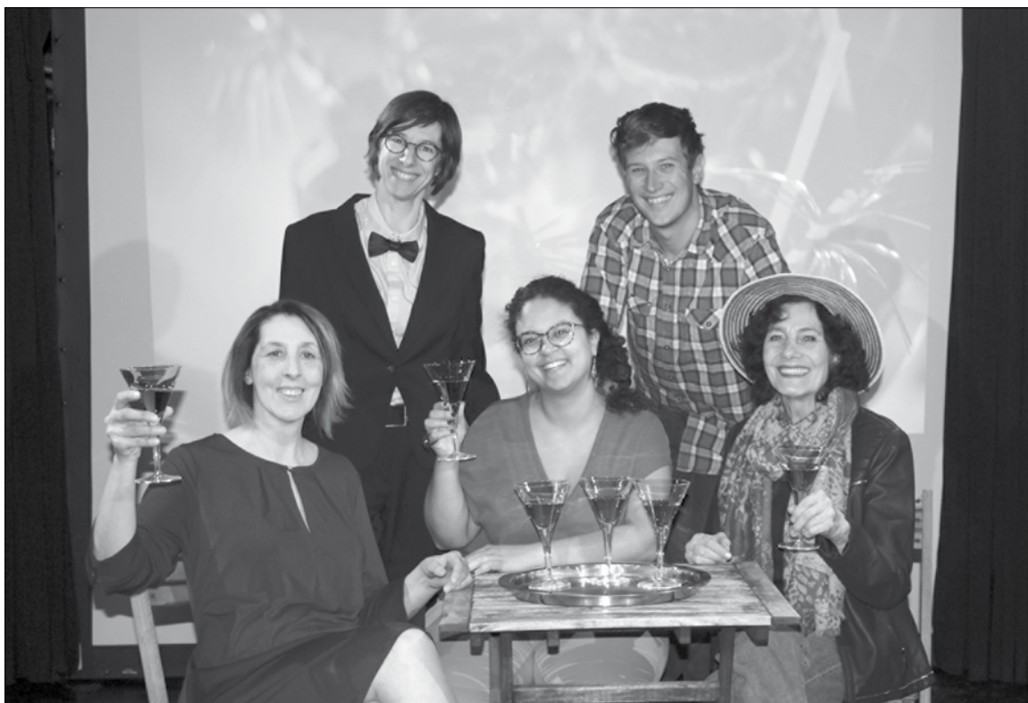
Les cinq comédien.nes de la troupe de la Tournelle ont hâte de vous présenter leur film-théâtre, fruit de deux ans de préparation.

En effet «Thétâtret» de prime abord peut interpeller, sa signification semblant mystérieuse et sa prononciation un brin laborieuse. Rien de plus normal, puisqu'il s'agit d'un néologisme créé par Jean-Michel Ribes affirmant que le «t» a une valeur structurante dans le vocabulaire. Ainsi pour renforcer le mot